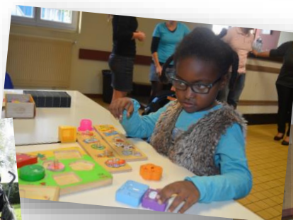
Gouters, rencontres en famille