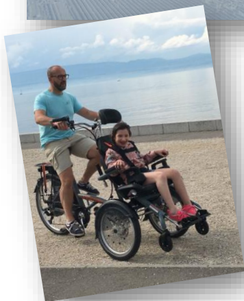
Fauteuil hippocampe et vélo-fauteuil