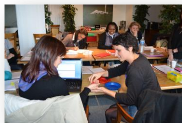
Formations parents professionnels