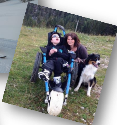
Fauteuil hippocampe et vélo-fauteuil