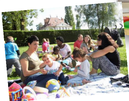
Gouters, rencontres en famille