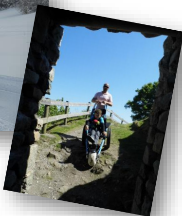
Fauteuil hippocampe et vélo-fauteuil