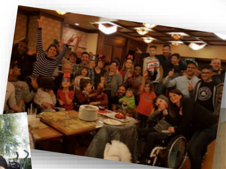
Séjours, rencontres en famille, rencontres de parents